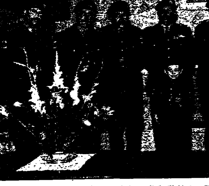
سمو الامير عبد الله بن الحسين يتوسط قاصدو ضباط الكلية التي تحمل اسم سموه اثناء زيارتهم للكلية بعيد ميلاده السعيد

نكا - قال جلالة الملك المعظم ان الاردن سيواصل وقوفه الى جانب باكستان وتسكنا جلالاته في حفل الاستقبال الذي اقيم على شرفه في مدينة دكا بباكستان الشرقية بعد ظهر امس ان الشعب العربي مصمم على المضي قدما لواجهة تحدي اسرائيل واستعادة الحق والكرامة وحراسة الاماكن المقدسة التي تعتبر من تراث العرب الخالد كما تعتبر ايضا من تراث العالم الاسلامي . وشكر جلالة الملك المعظم ان الشعب العربي بامر يدين باكستان بالثكر لتأييدها الامة العربية وقضيها العادلة .